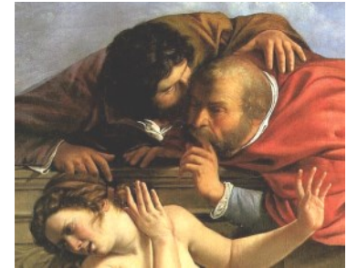
'n Geredigeerde weergawe van die skildery getiteld "Susanna and the Elders" Dit is deur die skilder Artemisia Gentileschi.

ONS KANTOORURE is Ma: 09:00 - 13:00 Di - Vr: 08:00 - 13:00